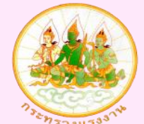
จำแนกตามอาชีพความต้องการจ้างแรงงาน (คน)